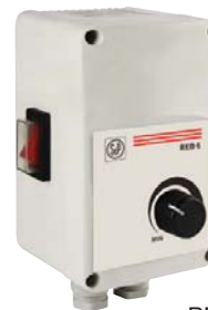
REB 5; REB 10