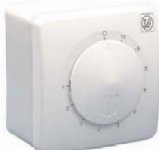
REB 1 N; REB 2,5 N