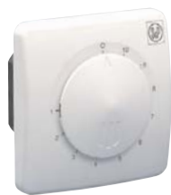
REB 1 NE; REB 2,5 NE

REB 1 N, REB 1 NE, REB 2,5 N, REB 2,5 NE, REB 5, REB 10 – regulátory otáček