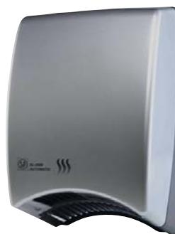
SL-2008 AUTOMATIC SILVER