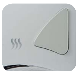
Spouštěcí tlačítko SL-2008