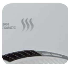
Senzor pohybu SL-2008 AUTOMATIC / AUTOMATIC SILVER